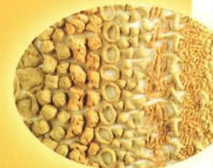
Соевые текстуранты и протеины