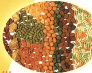
Корма для домашних животных и рыб