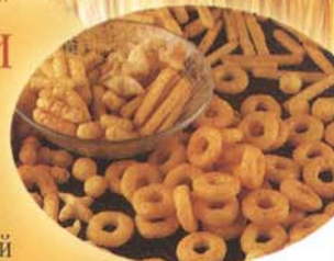
Снеки, Палочки, Колечки.....

Оборудование и технологии французской Группы КЛЕКСТРАЛЬ позволяют Вам производить из Вашего сырья широкий спектр продукции: продукты питания, корма, ингредиенты... При небольших инвестициях, Вы сможете повысить Вашу рентабельность и открыть новые рынки сбыта для Вашей новой продукции.