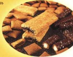
Ко-экструдированные продукты, подушечки, Хлебцы...